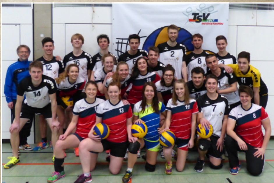
Die Volleyball-Abteilung Herren und Damen, 2017

In den Schaufenstern der Weinheimat stellen wir seit Januar für das gesamte Jubiläumsjahr einige Exponate unserer historischen Sammlung aus. Schauen Sie doch mal vorbei – Memminger Straße 4